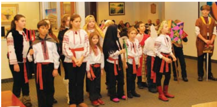
St Nicholas Cathedral School students visit Selfreliance with their Vertep Діти зі Школи св. о. Миколая виступають з Вертепом у "Самопоміч".