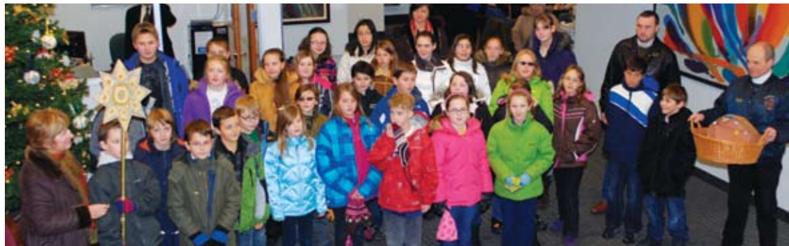
Chicago's Ridna Shkola students visited SUAFCU at Christmastime. Учні "Рідної Школи" відвідали "Самопоміч" з колядою.