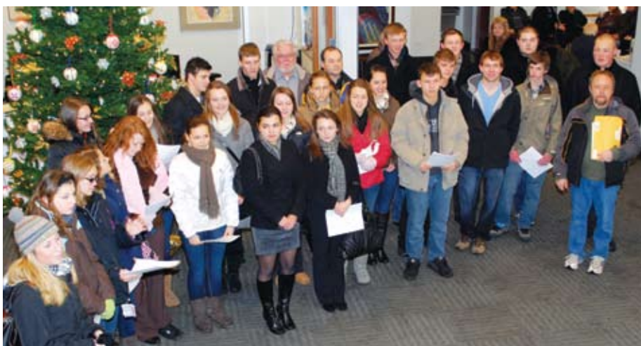
Carolers from CYM Pavlushkov Branch visit Selfreliance. Молодь з Осередку СУМ ім. М. Павлушкова колядують у "Самопоміч".