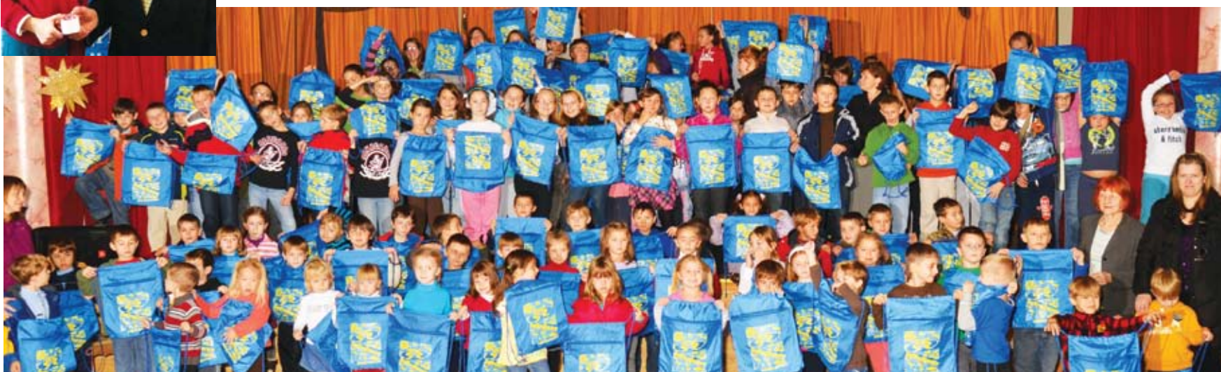
Students of St. Joseph Ukrainian School in Chicago with their Selfreliance bags. Учні школи св. Йосифа Обручника в Чикаго з подарунками від "Самопоміч".

Read more about our community involvement on our YouTube site: http://www.youtube.com/user/selfrelianceUAFCU На сайті YouTube можете довідатися докладніше про співпрацю Каси з громадою.