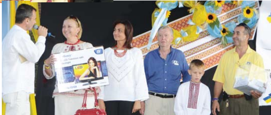
Winner of television at Ukrainian Days festival in Chicago. Українські Дні в Чикаго: нагороджується телевізор.