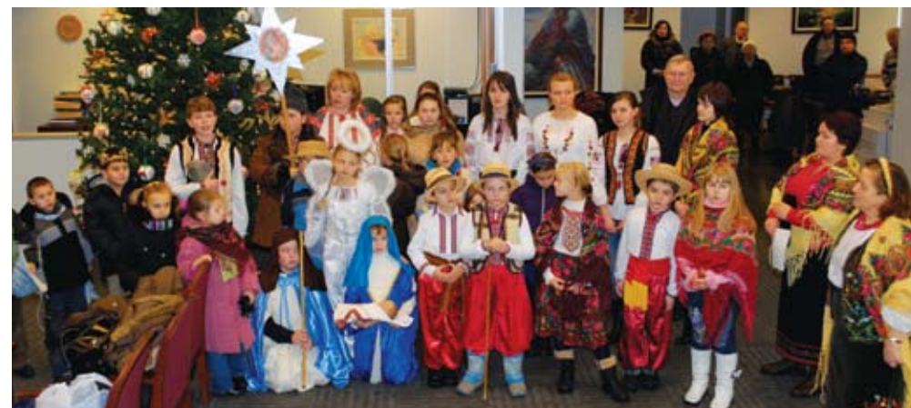
Students of St. Volodymyr UOC School visited SUAFCU at Christmastime. Учні Школи Українознавства парафії св. кн. Володимира в Чікаго заколядували у "Самопоміч".