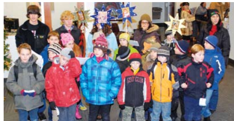
Children from Plast-Chicago caroling at Selfreliance. Пластуни зі станиці Чікаго колядують у "Самопоміч".