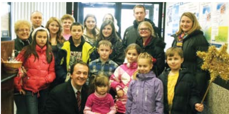
Students of Jersey City Ridna Shkola carol in SUAFCU Office Колядують учні "Рідної Школи" Джерзі Сіті.

Carolers from Ukrainian youth organizations, schools, choirs and cultural groups visit Selfreliance offices, extending Christmas greetings to SUAFCU leaders, staff and visitors.