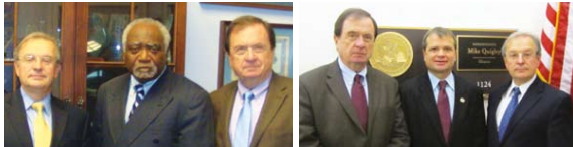
Провідники Каси плекають позитивні зв'язки з представниками уряду, головну у справах, які впливають на діяльність нашої установи або на наших членів. У фотографіях: Президент Дирекції Каси Михайло Р. Кос і Президент установи Богдан Ватраль на різних зустрічах із представниками зі штату Ілліной до Конгресу США. 1-ий ряд зліва: Сенатор Марк Кірк; з-права: представник до Палати Репрезентантів Джуді Біггерт; 2-ий ряд зліва: Конгресмен Данні Дейвіс; з-права: Конгресмен Майк Квіглі; 3-ій ряд зліва: Конгресмен Ранді Галгтрен; з-права: Конгресмен Данієл Липинський.